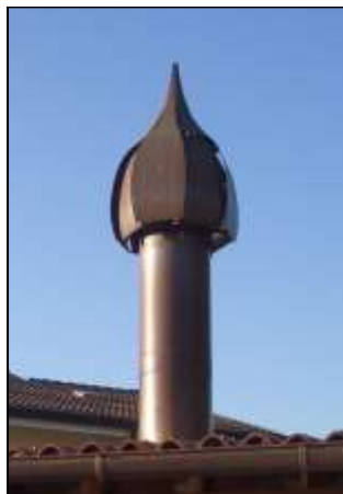
ドロミテキャップ