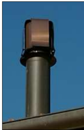
サムライキャップ